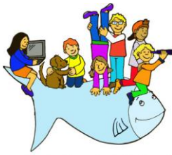
Evangelische Grundschule Bensberg

einrichten, denn die Natur bietet eine unvergleichbar kindgerechte Bildungseinrichtung ohne Wände und Dach.